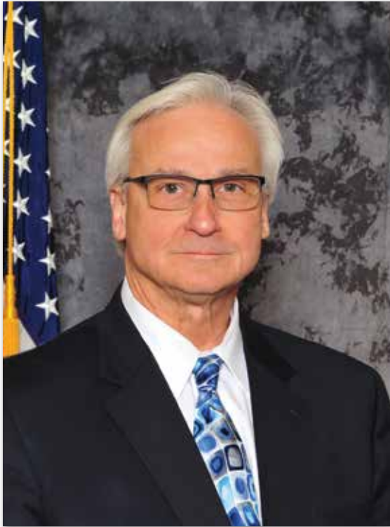
MAYOR ANDREW PRZYBYLO Mayor of The Village of Niles